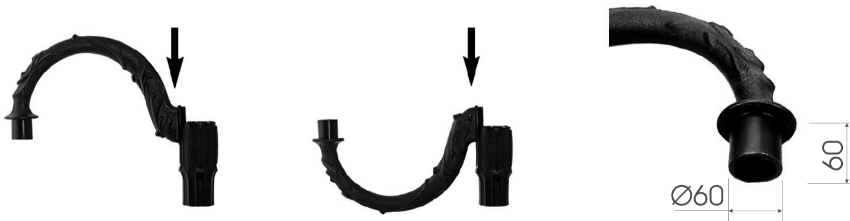
Способ монтажа консолей в головке вверх или вниз